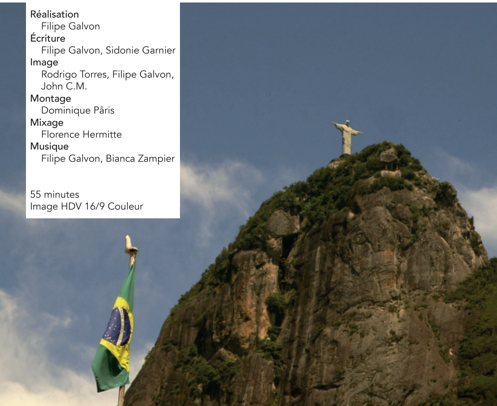
Image HDV 16/9 Couleur