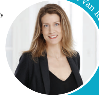
Adèle Van Reeth

La philosophe Adèle Van Reeth reçoit, dans l'annexe de la bibliothèque du Sénat, une personnalité de l'art, de la pensée ou de la politique, pour une discussion intime au long court sur les livres qu'ils ont écrits et ceux qui les ont construits.